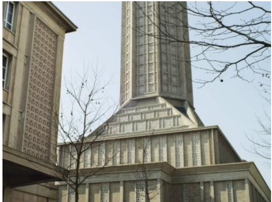
מתוך הסרט "פרה בצרפת ואלג'יריה": קתדרלת סנט ג'וזף, לה הבר, צרפת, 1951-1958.

ב-2005 הוכרז מרכז העיר לה הבר המחודש על פי תוכניתו של פרה כאתר מורשת עולמית על ידי אונסק"ו. התוכנית המקורית עברה שינוים רבים בדרך ליישומה, ורעיונות נועזים רבים נגנזו, בהם הרעיון להגביה את מפלס הקרקע בשכונה הנמוך מפני הים ומועד להצפות. עם זאת, ועדת אונסק"ו ציינה את השכונה כראויה לתואר בזכות של "השילוב המושלם של מודרניזם ומסורת, אדריכלות, טכנולוגיה ותכנון ערים", כפי שנכתב בנימוקים.